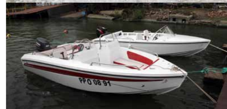
Два варианта компоновки «Дончака» в одном корпусе