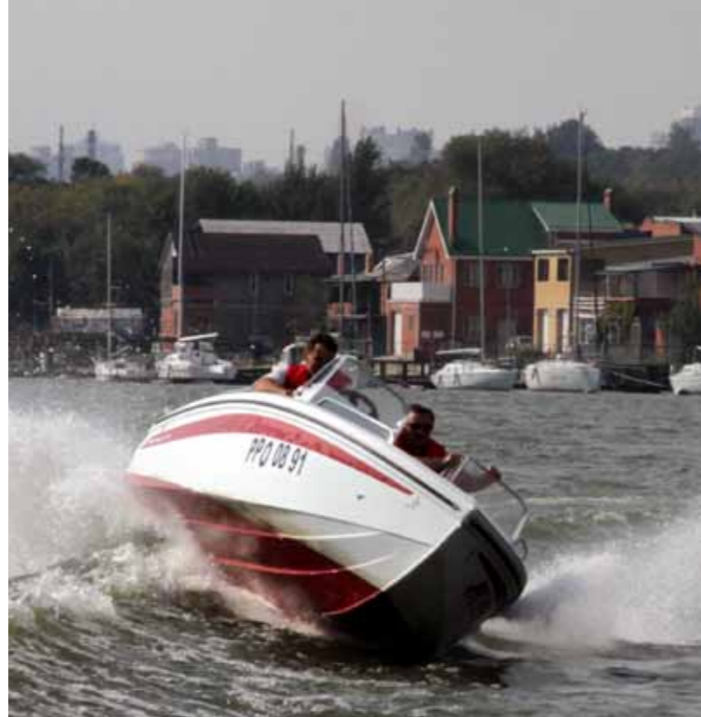
Обе лодки на разведенной тяжелым катером волне вели себя надежно и предсказуемо даже в экстремальных ситуациях

1812-го. Видимо, лодка с таким именем должна обладать легким быстрым ходом и неприхотливостью в эксплуатации. Представленные модели оборудованы довольно мощными для своих размеров моторами: у палубной модели «Дончак 4.7» установлен 50-сильный Tohatsu с винтом размером 11.1x13 дюймов; на двухконсольной «Дончак 4.7V» – Yamaha-60 с винтом 11x15”.