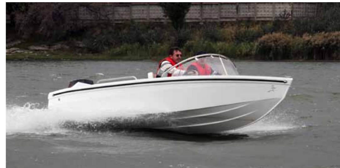
Фаворит теста – «Дончак-4.7» с «автомобильной» запалубленной компоновкой

Обнаруженные особенности хода «Дончака 4.7» – быстрый выход на глиссирование, малая чувствительность к нагрузке, осязаемый дрейф на повороте – все это, включая запалубленную компоновку – черты универсальной умеренно-килеватой легкой лодки, которую мы уверенно относим к «народному» типу, давно и прочно зарекомендовавшему себя на реках и озерах страны. Двухконсольному варианту «-4.7V» повезло в нашем тесте меньше. Более мощная на добрый десяток сил Yamaha-60 исправно крутила обороты 15-дюймового по шагу винта, но адекватной прибавки к скорости обнаружить не удалось. Трудно сказать, что стало причиной конфуза – недобравший мощности двигатель или особенность центровки (двухконсольная на ходу показывала несколько больший дифферент) – понятно, что с этой компоновкой надо еще поработать. По нашим наблюдениям, при длине корпуса менее 5 м полноценный двухконсольник реализовать непросто. То центровка получается слишком кормовой, то носовой кокпит излишне куцей. В общем, запалубленный вариант «Дончака 4.7» здесь показал себя с лучшей стороны, хотя носовая посадка водителя у него и влечет неудобства вроде более близких ударов о волну и некоторой тесноты в зауженной носовой части. Пожалуй, строителям стоило бы придать и больший